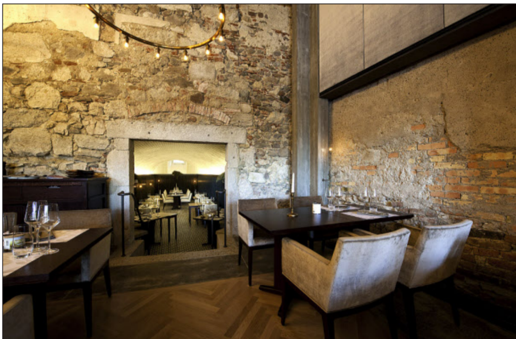
Das ehemalige Salzlager der Stadt Solothurn neu interpretiert: Elegantes Ambiente im «Salzhaus».