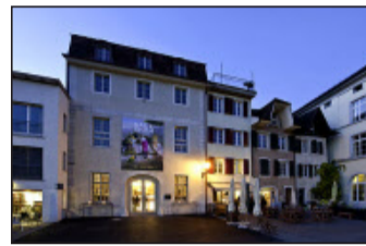
Das neue Restaurant Salzhaus liegt direkt an der Aare.