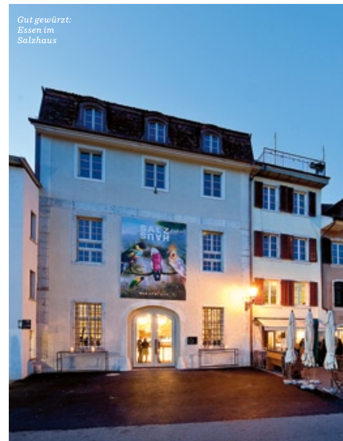
Gut gewürzt: Essen im Salzhaus

— Boutique Danoise, Aeschenvorstadt 36, 4051 Basel, Tel. 061 271 20 20, www.boutiquedanoise.ch