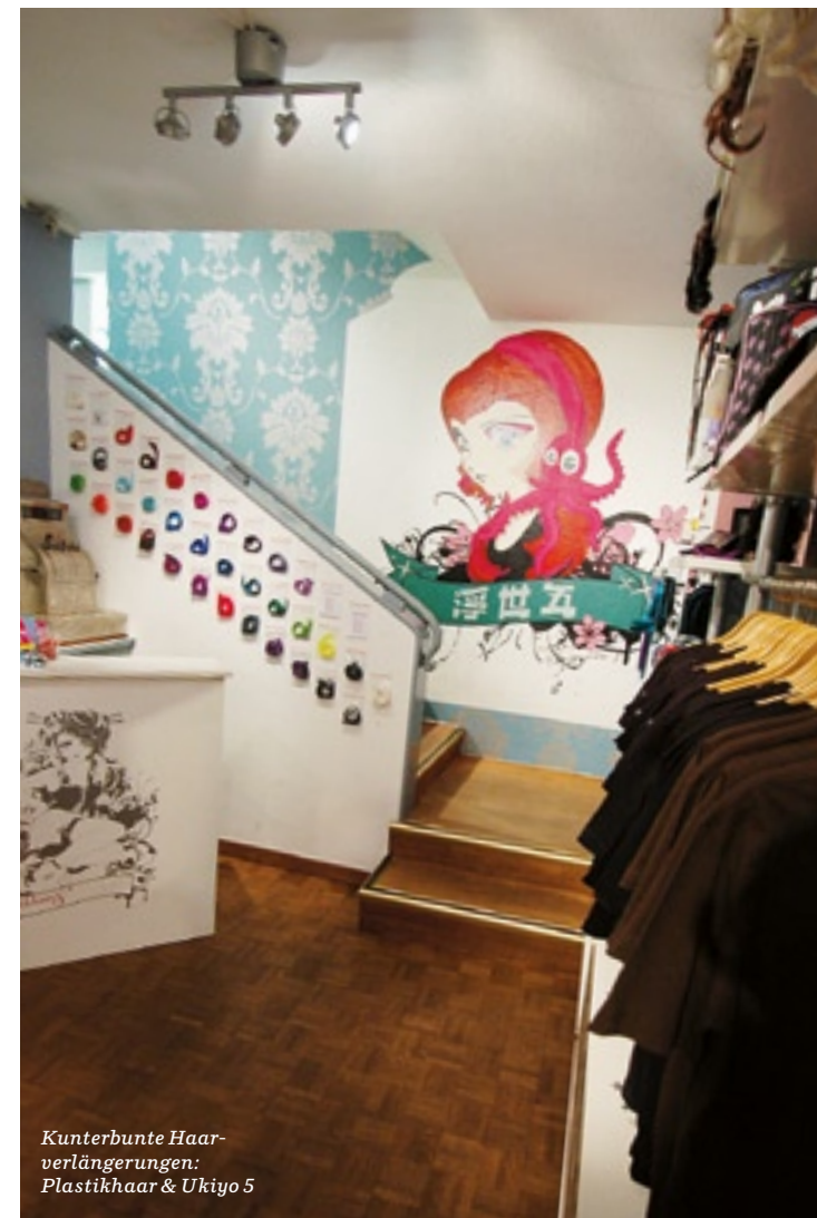
Kunterbunte Haarverlängerungen: Plastikhaar & Ukiyo 5

— Salzhaus, Restaurant Bar, Landhausquai 15a, 4500 Solothurn, Tel. 032 622 01 01, www.restaurant-salzhaus.ch